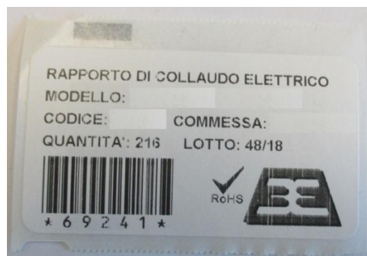
FIGURA 3. RAPPORTO DI COLLAUDO ELETTRICO